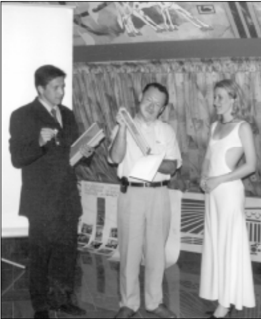
Награждение победителей "Хрустального колокола".