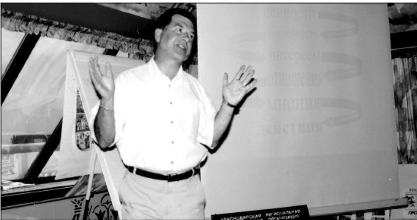
Участники "Хрустального колокола".

На проведение мероприятий кампании администрацией города, лесопользователями было выделено около 200 тысяч рублей.