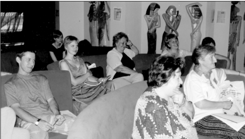
Участники "Хрустального колокола".

2002г- М.С.Тохтаходжаева: «Утомленные прошлым» на русском и узбекском языках, по 1000 экз.