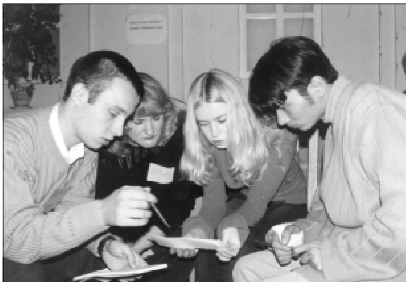
Школа по связям с общественностью. 2003 год.

при этом зачастую не понимая, что эти организации являются общественными, решают социальные проблемы населения и могут выступать в этой работе эффективными партнерами с государственными структурами и коммерческими организациями, занимающимися благотворительностью.