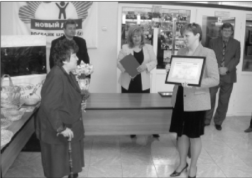
Вручение дипломов победителям грантовой программы "Новый день".

Развитие третьего сектора на юге России серьезно тормозит отсутствие регулярной объективной информации о деятельности НКО, доступной для широкой общественности. В течение последних нескольких лет профессиональный уровень НКО на юге России в работе по связям с общественностью значительно вырос. Тем не менее общее представление населения об их деятельности остается достаточно размытым. Жители региона называют отдельные сильные организации,