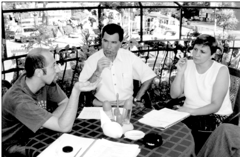
Экспертный совет "Хрустального колокола".

Основным результатом реализации социокультурного проекта «Трамвай желаний» стало образование содружества молодежных организаций, НКО, образовательных и муниципальных учреждений, представителей бизнеса и СМИ (более 40 организаций-партнеров), заинтересованных в формировании здорового образа жизни подрастающего поколения и принимающих активное участие в реализации проекта. В благотворительных социокультурных акциях в Трамвае желаний принимали участие студенты ИжГСХА, ИжГТУ, УдГУ, Ижевского педагогического колледжа, школьники средних школ, воспитанники детских творческих студий — всего более 250 человек. За период с 1999г. по 2003г. в городских, республиканских и российских СМИ вышло более 150 публикаций, более 50 радио- и телесюжетов.