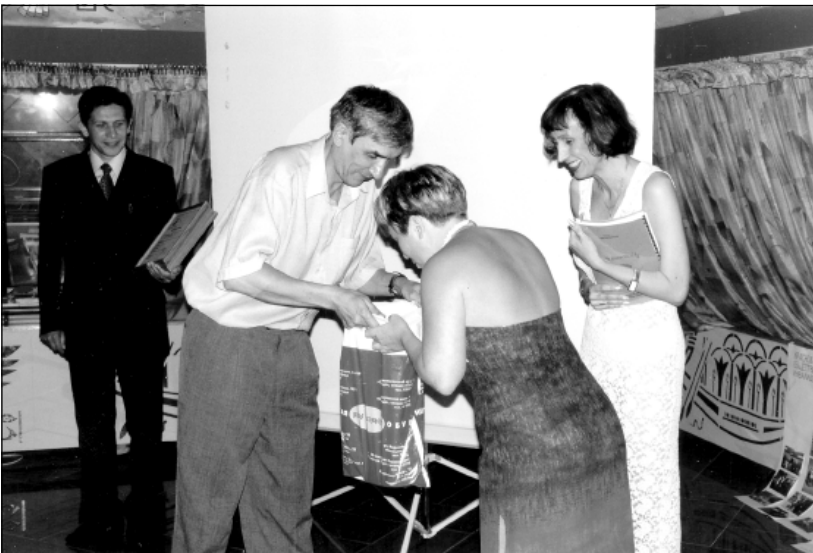
Участники "Хрустального колокола".

между организациями инвалидов и профессиональными кинематографистами, их объединениями, журналистами, специалистами, работающими с инвалидами. Фестиваль стал стимулом для журналистов для дальнейшего освещения этой тематики. В ходе подготовки к фестивалю собрана уникальная коллекция фильмов и видеоматериалов, которая насчитывает более 130 фильмов и телепрограмм из 23 стран мира. Большая часть этих фильмов переведена на русский язык и широко используется для просвещения общественности.