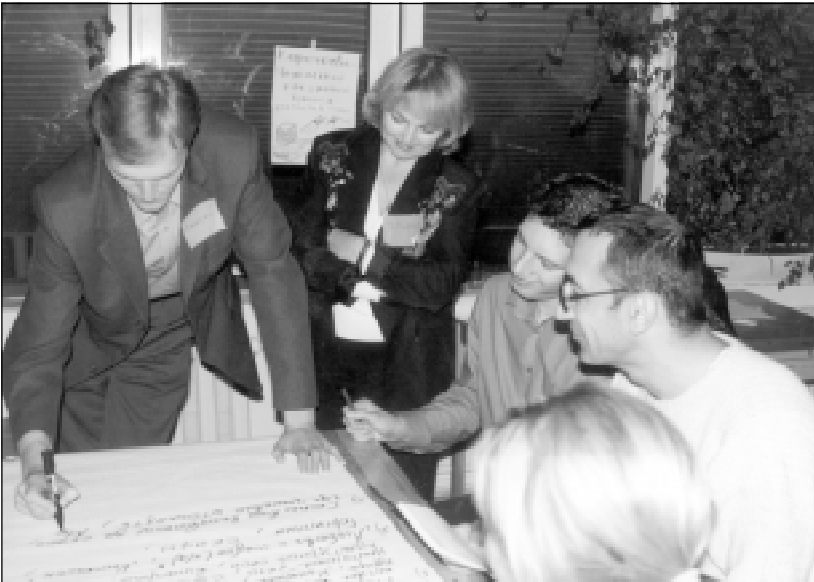
Школа по связям с общественностью. 2003 год.

Еще одним важным направлением в PR-деятельности ЮРЦ является издательская деятельность. ЮРЦ изданы 43 методические разработки и информационно-справочные пособия. ЮРЦ издает ежеквар-